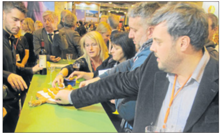
El público disfrutó de las tapas de vanguardia preparadas por los chefs Aragüez y López en los cinco días de actividad ferial. JUAN SUÁREZ