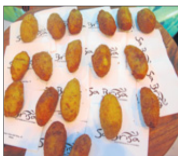
Croquetas de 'bullit de peix'.

Las tapas revisadas de platos y sabores tradicionales ibicencos causan sensación en Fetur