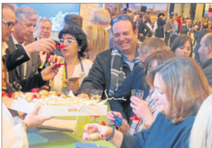
Éxito rotundo de la gastronomía local en stand de Fetur.

Las tapas revisadas de platos y sabores tradicionales ibicencos causan sensación en Fetur