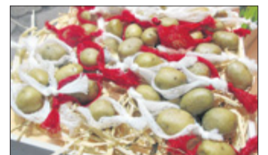
Patatas rellenas con calamar.